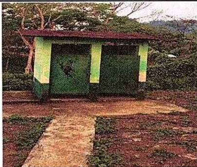
Foto 5: Techo de baños en mal estado, con necesidad de cambio. MODULO 3