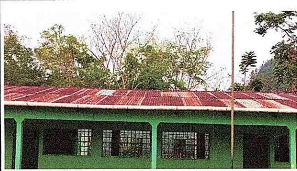
Foto1: Entechado del establecimientos en mal estado con necesidad de cambio MODULO 1