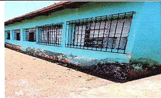
Foto 6: Pared en mal estado, con necesidad de pintura, exterior. MODULO 4

Observación: Si es necesario se pueden agregar hojas adicionales y actualizar el número de hojas.