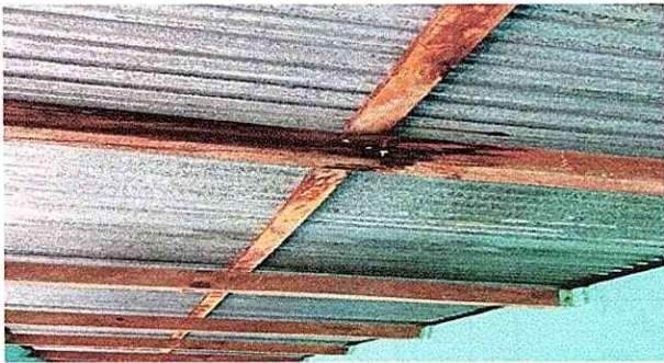
Foto 3: costaneras y vigas en mal estado, con necesidad de cambio. MODULO 1